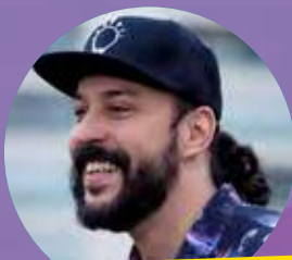
Gabriel O Pensador