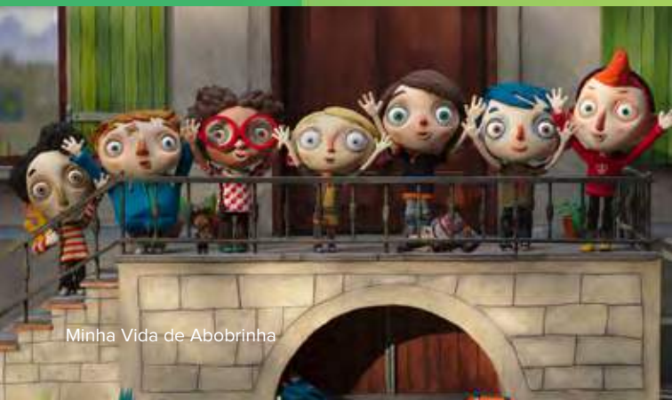
Minha Vida de Abobrinha