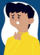
Dificuldade de respirar