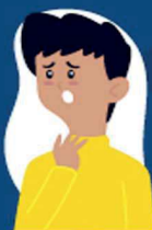
Dificuldade de respirar