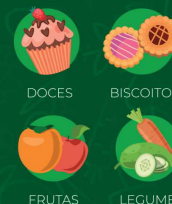
DOCES BISCOITOS FRUTAS LEGUMES